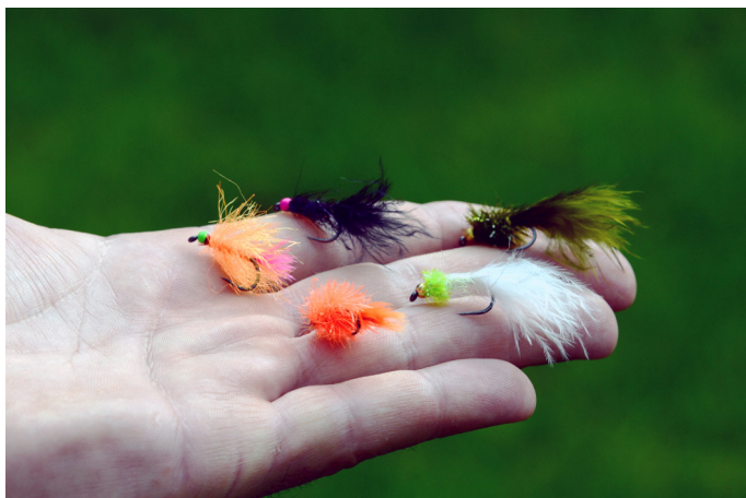
Le choix de Claude Strotz

Après un stockage, des blobs ou blobby's en orange ou jaune sunburst tirés en vitesse avec une soie plongeante S3 sont à recommander. Sinon, des petites noyées noires tirées en douceur sur une intermédiaire lente ou soie sèche pourraient vous sauver. Quand ça gobe, mettez une sèche suivie d'une noyée noire.